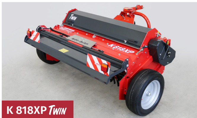
K 818XP TWIN