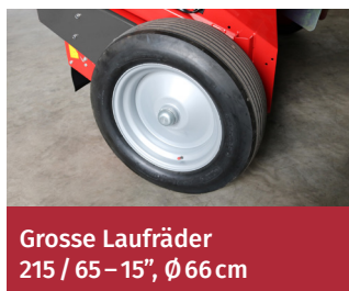
Grosse Laufräder 215 / 65 – 15", Ø 66 cm