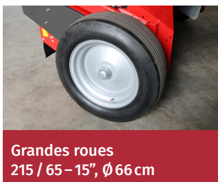
Grandes roues 215 / 65 – 15", Ø 66 cm