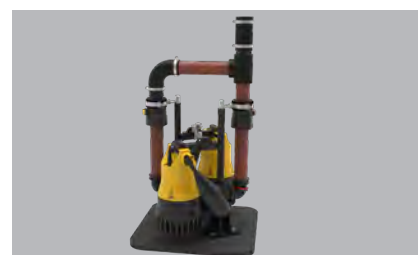
Pompes non comprises dans la livraison