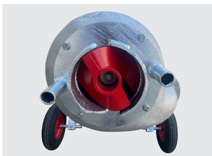
Hélice de pompe standard