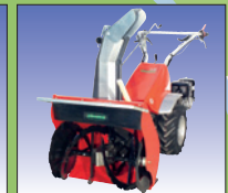
Schneefräse 60 cm

chasse-neige 120 cm avec tôles latérales