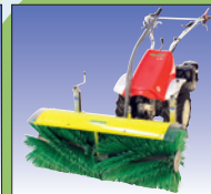
Kehrmaschine 100 cm m.o. Auffangbehälter

balayeuse 100 cm avec/ sans bac de ramassage