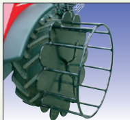
Gitterrad mit Schnellkupplung roue-grille à montage rapide