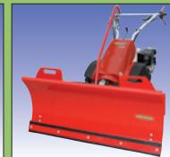
Schneeräumschild 120 cm m. Seitenblechen

balayeuse 100 cm avec/ sans bac de ramassage