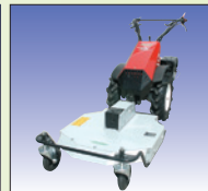
Sichel-Mulchmäher 65 cm/75 cm