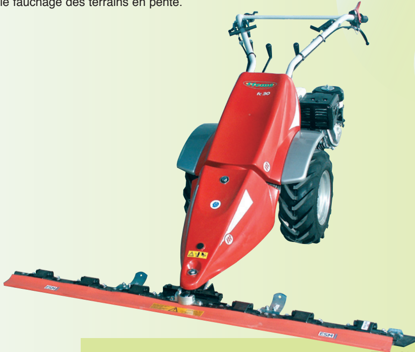
mit Mähwerk / avec barre de coupe 142 cm Fr. 5'900.–

Motofaucheuse puissante et confortable, pourvue d'un moteur à essence de 9 cv. Un inverseur à 4 vitesses en marche avant et 3 vitesses en marche arrière, un différentiel blocable et un dispositif de raccordement rapide pour les différents outils assurent un travail prompt et efficace. Le mancheron réglable en hauteur et muni d'un système antivibration rend le fauchage aisé et agréable même sur de grandes surfaces. La machine dispose de choix d'une barre de coupe ESM ou d'une barre à doigts, mesurant jusqu'à 175 cm et fonctionnant par transmission à bain d'huile (à faible usure). Sa construction basse et le frein intégré standard en font un outil sûr et idéal pour le fauchage des terrains en pente.